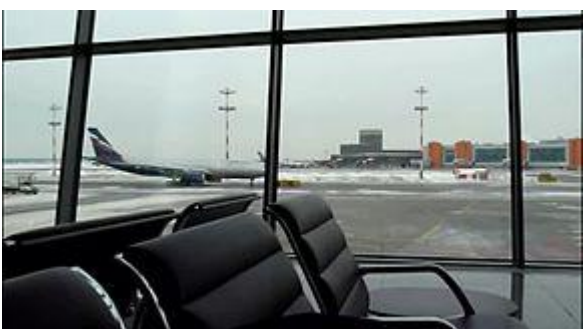
Aeroporto di Mosca-Šeremet'ev, Mosca