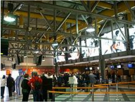
Aeroporto di Firenze-Peretola

In Italia , la gestione degli aeroporti civili è spesso svolta da compagnie di gestione locali, come ad esempio la Società Aeroporti di Roma (AdR) o la Società Esercizi Aeroportuali di Milano (SEA) o la Società Gestione Aeroporto Internazionale di Torino (SAGAT). La gestione delle norme in materia aeronautica spetta all' Ente Nazionale per l'Aviazione Civile (ENAC), mentre la gestione del traffico aereo è di competenza dell' Ente nazionale assistenza al volo S.p.A. (ENAV), dell'Aeronautica Militare, o da altri fornitori di servizi a seconda degli aeroporti. [3]