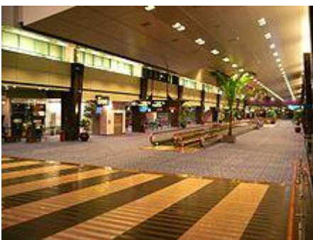
L'interno di un moderno terminal aeroportuale. Aeroporto di Singapore-Changi, Singapore